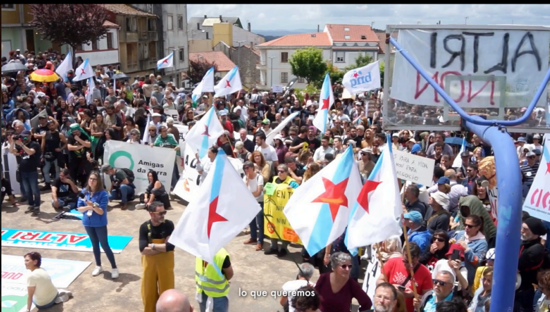
lo que queremos