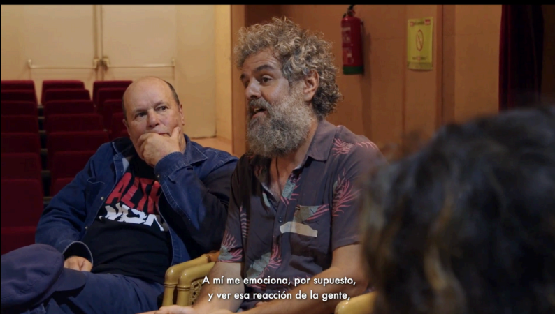
A mí me emociona, por supuesto, y ver esa reacción de la gente,